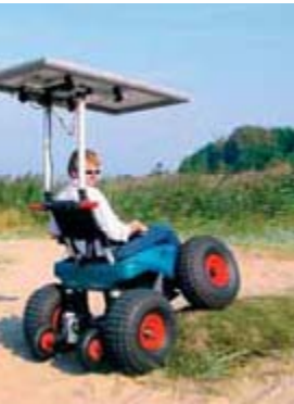
Strandrollstuhl mit Solarantrieb: Das CadKat mit Ballonrädern passt ohne Mühe in eine Wohnmobil-Heckgarage.