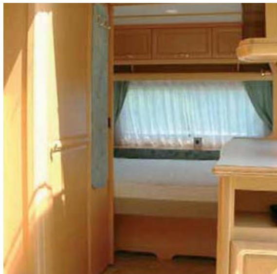
Festbett bei Grimm: Klassisches Doppelbett im Fahrzeugheck, Heizungsluft entströmt Lüftungsschlitzen unter dem Bett.

Weit verbreitet sind Sitzecken, die zu Doppel- oder