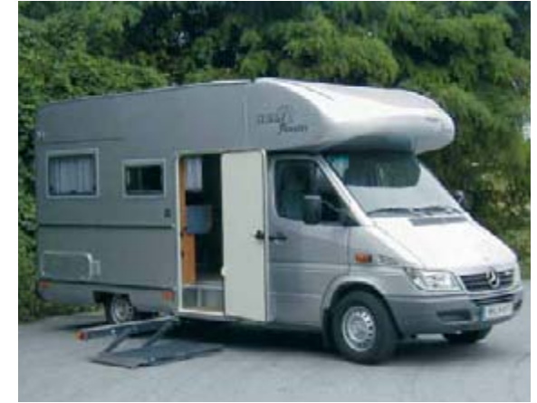
Hehn-Mobil auf Mercedes-Sprinter: Die Hebebühne bringt den Rollstuhlfahrer durch die breite Einstiegstür nach innen.